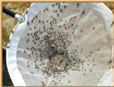
Captura en manga entomológica