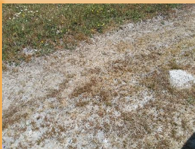
Detalle de zona afectada