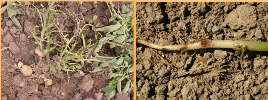
Planta afectada por rizoctonia

✓ Ejerce un efecto negativo en la emergencia y desarrollo de plantas, provocando menores rendimientos comerciales.