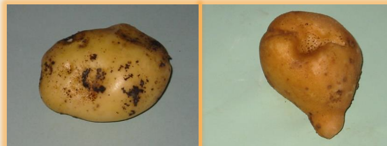
Esclerocios en tubérculo

✓ Las infecciones severas provocan nascencias irregulares y falta de plantas.