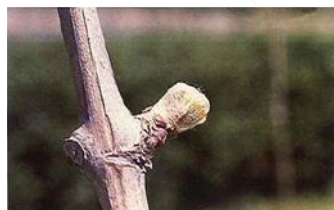
Punta verde (Estado C)