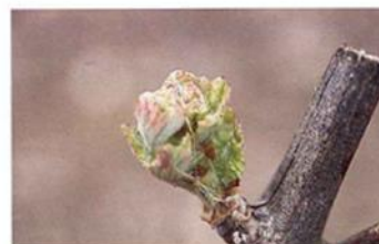
Hojas incipientes (Estado D)