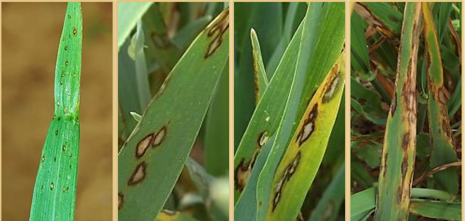
Evolución de la expresión de las manchas en hoja