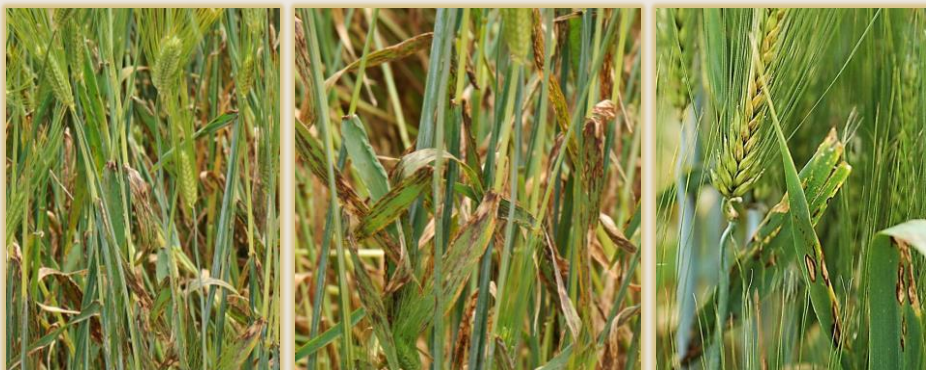
Afectación severa en hojas superiores y espiga