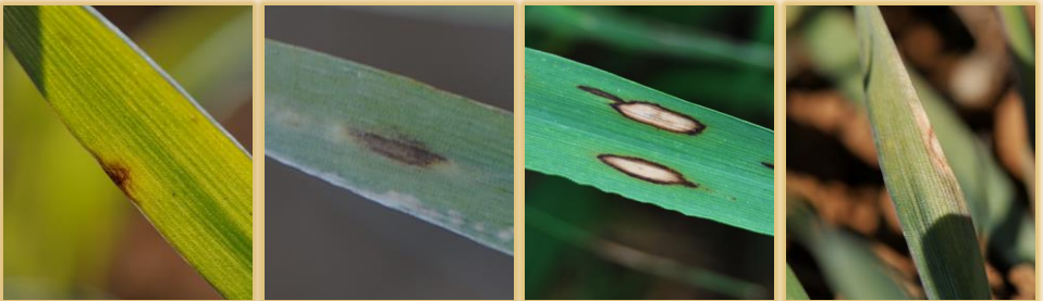
Evolución de las manchas

Muy común en Castilla y León, ocurre con relativa asiduidad. Sin embargo, sólo si se superan los umbrales de tratamiento puede constituir un problema significativo.