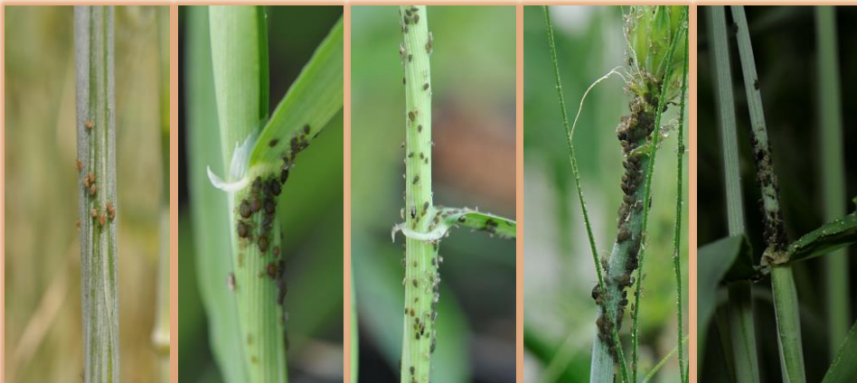
Arriba: adultos (alados y ápteros) y ninfas. Abajo: colonias de pulgón, distintas especies.