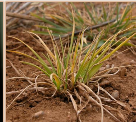
Síntomas de BYDV