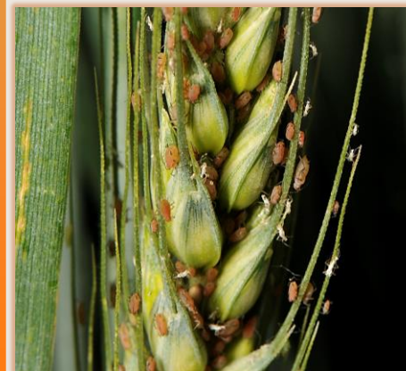
Pulgones en espiga