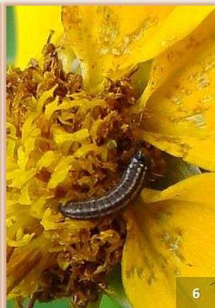
Adultos y larvas actuando sobre el capítulo